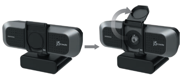
Product Dimensions : 10.6(W) x 6.36(D) x 6.46(H) cm